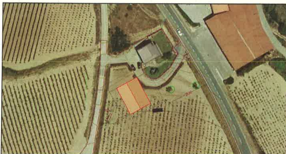
Figura 1. Representación del ámbito previsto para la construcción del edificio del almacén

La nueva edificación se proyecta situar junto a otra edificación existente que cuenta con todos los servicios (acometidas de agua, saneamiento-fosa séptica, luz y telecomunicaciones) y con accesos ya construidos. El edificio tendrá planta rectangular de 18m x 14m y 252 m 2 . Se orienta de manera que su eje longitudinal adopte una dirección paralela a la de la carretera A-3214 en este punto. Como únicos movimientos de tierra se contemplan los necesarios para ejecutar las zapatas de la cimentación.