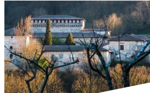
Plan Estratégico Comarcal de Aiaraldea 2025